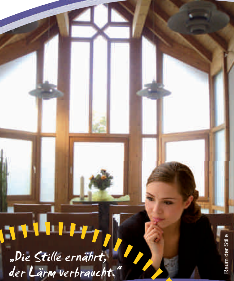
Raum der Stille

„Die Stille ernährt, der Lärm verbraucht.“